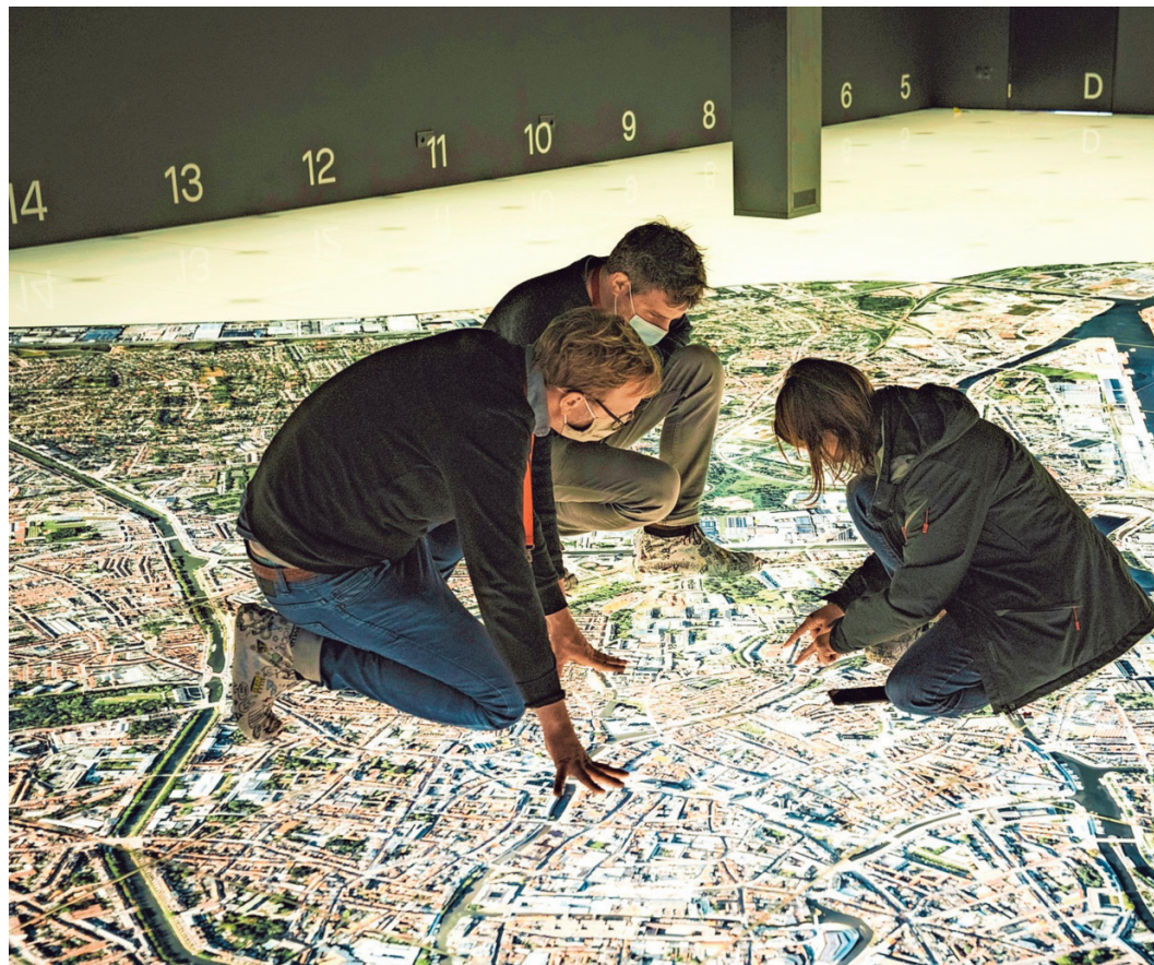
Zoeken op de nieuwe luchtfoto kan volgens het zeeslag-systeem.

pyjamamerk Woody. Gelukkig, want de tentoonstelling zelf is opgebouwd door het Nederlandse Kinkorn uit Tilburg. «We moesten met een Europese aanbesteding werken, en Kinkorn kwam er als beste uit.» Aan het historische Bijlokegebouw is uiteraard niets veranderd, maar de volledige inhoud werd wel herbekeken. «We werken opnieuw chronologisch, en niet per thema, om de geschiedenis van Gent te vertellen, maar dat is zo wat het enige wat we behouden hebben», zegt Dewilde. «Bij de aanpassingen is rekening gehouden met een ruime bevraging die