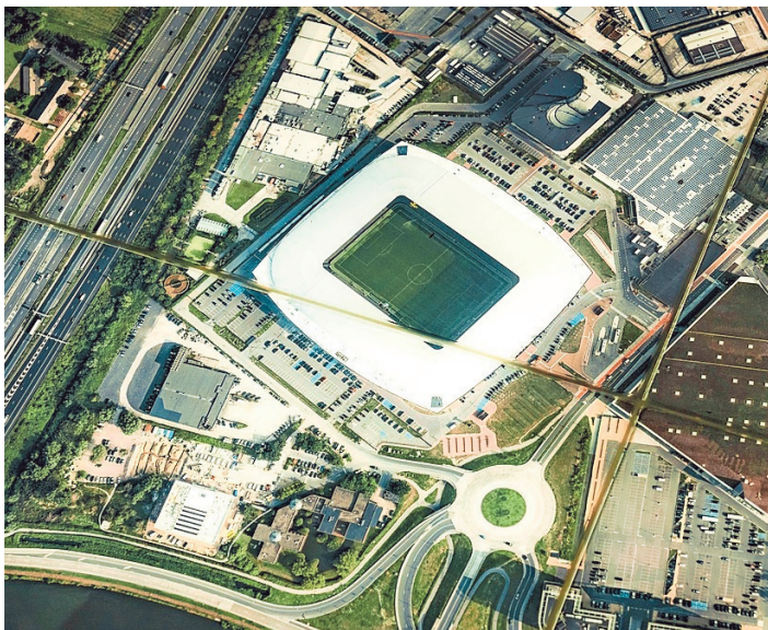
Ook de Ghelamco Arena staat nu op de luchtfoto.

Het stadsmuseum STAM vierde in stilte zijn tiende verjaardag. In de sluitingsperiode is het populaire museum omgebouwd. De geschiedenis van Gent is niet herschreven, maar wordt wel anders gebracht: meer interactie, meer aandacht voor minderheden en vrouwen, en met leuke objecten. Van een speelgoedsoldaatje uit de middeleeuwen tot een stuk van het E17-brokkelviaduct, vanaf maandag is het te zien - op afspraak - in het STAM 2.0.