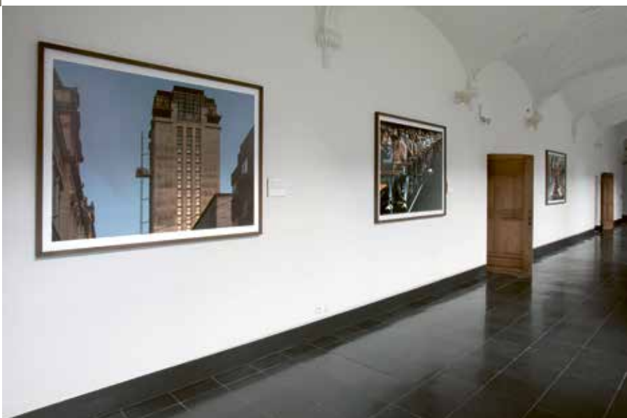
De foto's van Michiel Hendryckx brengen een journalistieke laag aan