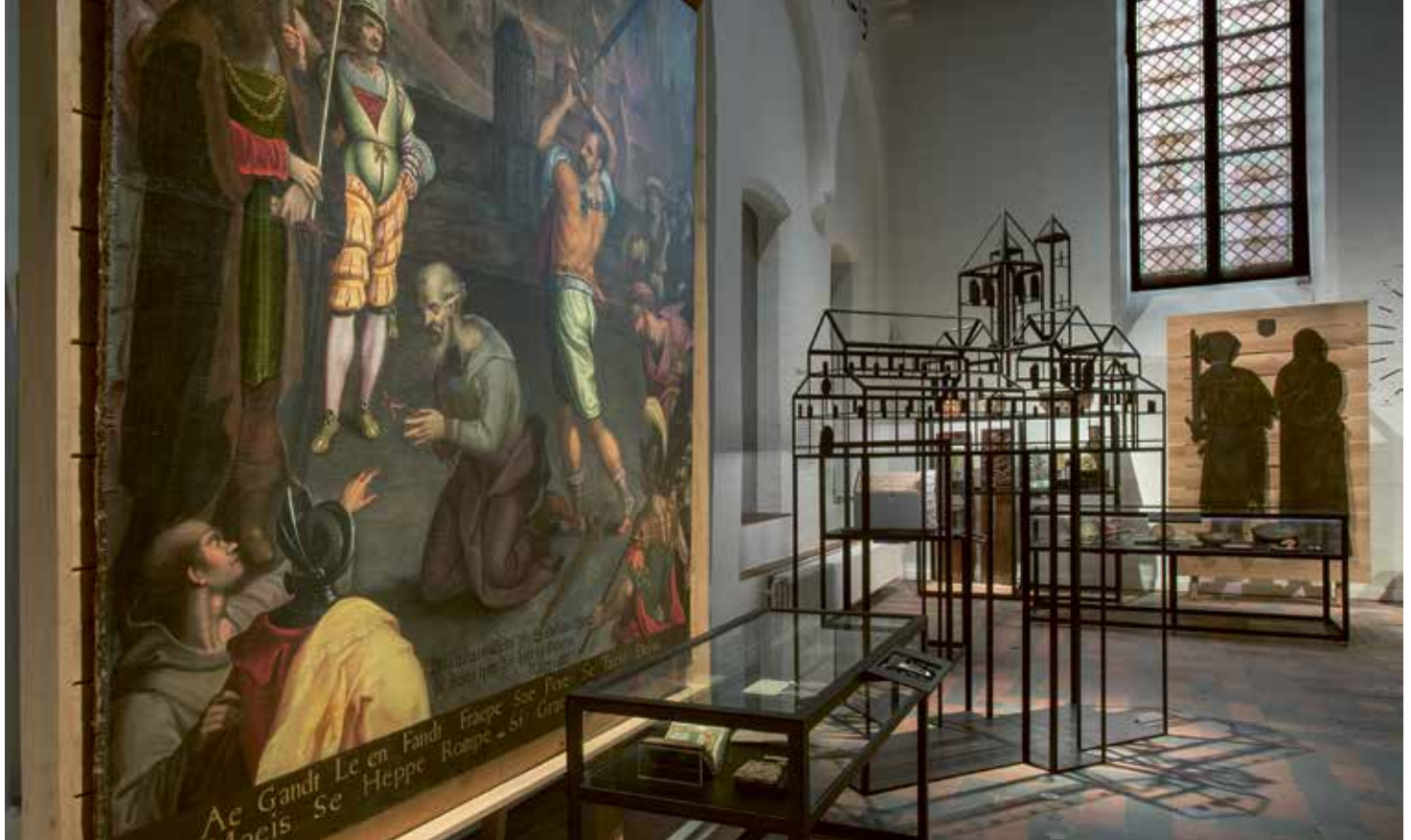
De transparante maquettes zorgen ervoor dat de ruimtes tot hun recht komen

Ook voor de Bijlokesite zelf is er op vraag nu meer aandacht. In de refter, met de muurschildering Het Laatste Avondmaal , die opzettelijk leeg werd gehouden, loop je nog de geschiedenis binnen. Een animatie laat zien hoe de abdij een hospitaal, een rusthuis en ten slotte een museum werd. In 1715 moderniseerden de zusters de refter met een stucplafond, maar vandaag is het tongewelf in al zijn glorie te zien.