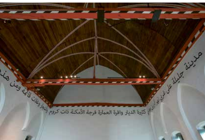
Hou de muren in de gaten voor de geschilderde opschriften zoals de oudste beschrijving van Gent uit 1154 door de cartograaf Muhammad al- Idrīsī