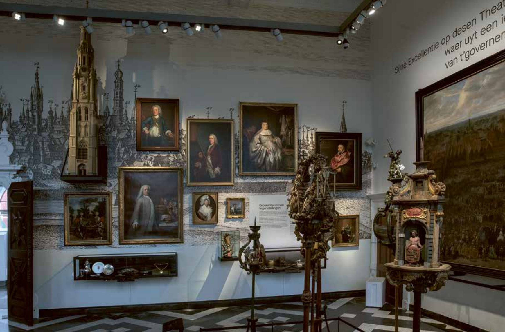
Een voorbeeld van de nieuwe compactere opstelling: de groeiende kloof tussen arm en rijk