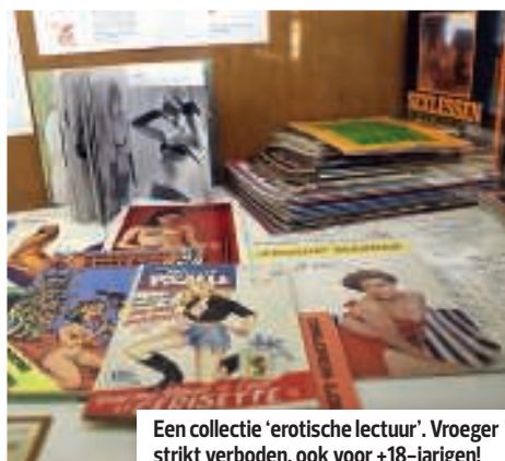
Een collectie 'erotische lectuur'. Vroeger strikt verboden, ook voor +18-jarigen!