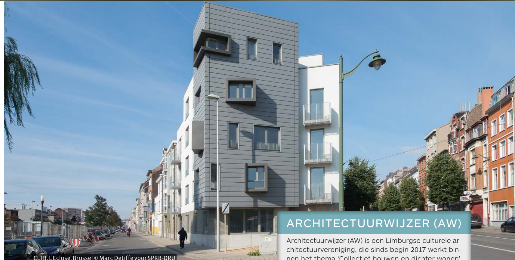
CLTB, L'Ecluse, Brussel

'Ruimtenaar' 7 om de middelen van de woonbonus te heroriënteren en te laten doorstromen naar burgerinitiatieven die betaalbare, collectieve huurwoningen realiseren.