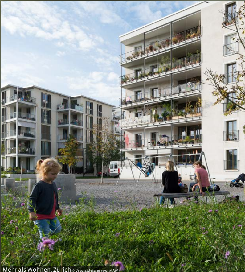
Mehrs als Wohnen, Zürich

de stad appartementen en studio's aanbieden tegen de helft van de gangbare huurprijs, ofwel circa vijf tot zeven euro/m 2 per maand. Daartoe wil ze een nieuwbouw realiseren op een terrein in Meulestede en een nieuw beheers- en financieringsmodel ontwikkelen. Voor dit project heeft de Stad Gent zelf een eerste volumestudie opgezet, maar het architecturaal ontwerp moet nog worden uitgewerkt. Ook hier geldt het principe dat bewoners een aantal ruimten (gastenkamer, logeerkamer, extra slaapkamer, wasruimte, werkruimte, vergaderruimte, bergruimte...) delen, en betalen naargelang het gebruik ervan.